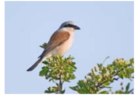
Projektbeispiel: Feldgehölze für den Neuntöter (ODW)

dann können Sie dafür Projektmittel beim RP Darmstadt - Obere Naturschutzbehörde (ONB) beantragen. Erste Ansprechpartner sind die Unteren Naturschutzbehörden (UNB), die eng in den Ablauf der Projektförderung eingebunden sind.