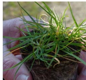
Projektbeispiel: Wiederansiedlung Zweifelhafter Grannenhafer (RTK)

Jede und Jeder kann sich auf vielfältige Weise für den Naturschutz und den Erhalt der biologischen Vielfalt einsetzen - dienstlich, im beruflichen Umfeld, ehrenamtlich oder privat. Schauen Sie doch mal in die Hessen-Liste, ob daraus etwas für Sie in Frage kommt.