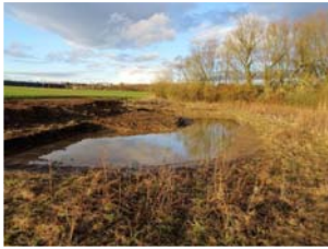
Projektbeispiel: Laichgewässer für die Wechselkröte (F)